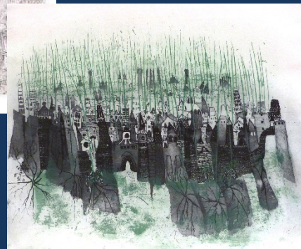
Milada Sukdoláková Overwoekerde Stad