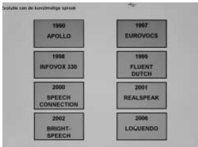
Evolutie van de kunstmatige spraak

vorig jaar organiseerden, kon de bezoeker de verschillende stemmen beluisteren.