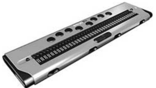
Esys 40 (560 g)