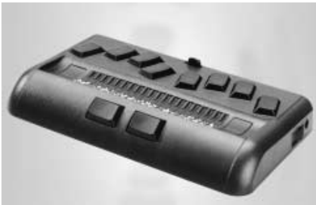
Brailino (688 g)