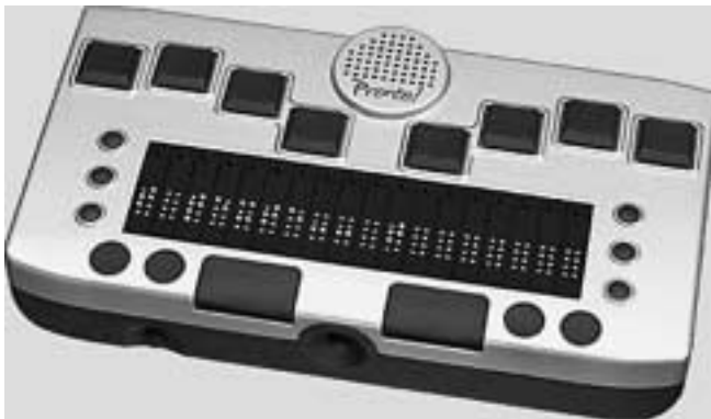
Pronto (450 g)