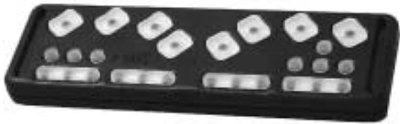
Nano PDA Lite (150 g) – dit apparaat is even klein en licht als een courante pda