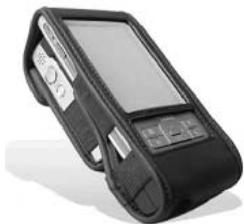
KNFB Reader (425 g) [pda- functies niet toegankelijk]