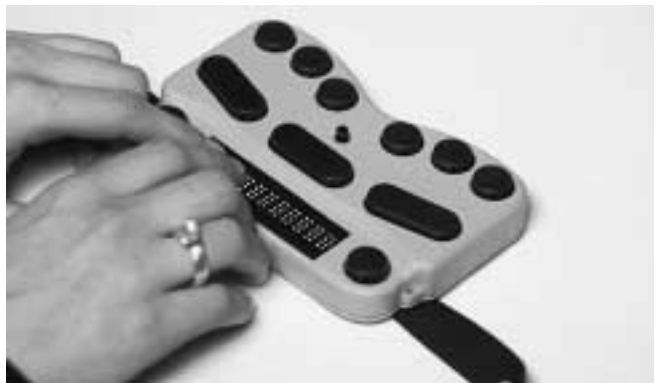
EasyLink 12 (260 g)