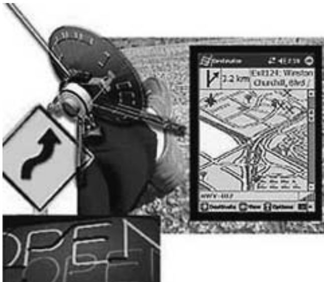
StreetTalk GPS Solution (met PAC Mate 1000 tot 1400 g) [pda-functies wel toegankelijk]

soort hulpmiddelen een essentieel gegeven is, vermelden we het telkens tussen haakjes.