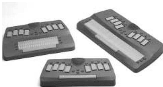
Euroscope (440 g) Euroscope 20/40 (680/918 g)