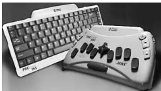
AC Mate BNS/BX/QX/TNS (820 – 1.200 g) – van dit apparaat bestaat een uitvoering met een gewoon toetsenbord