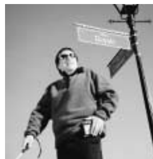
Trekker GPS (600 g) [pda-functies niet toegankelijk]