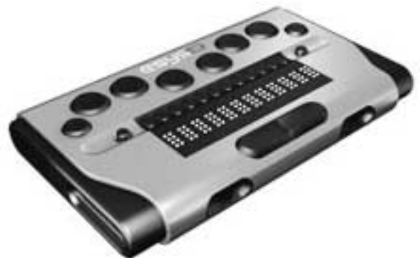
Esys 12 (200 g)