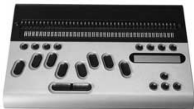
Iris 20/32/40 (1700 tot 1900 g)