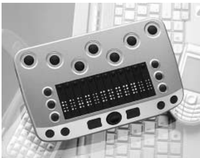
Conny (200 g)