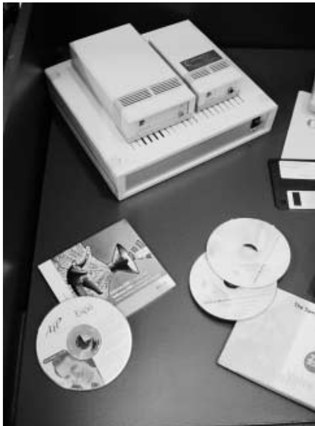
Synthetische spraak: van hardware naar software

De allereerste kunstmatige spraak was zeer moeilijk verstaanbaar en klonk zeer kunstmatig. Ondertussen is de kwaliteit van deze 'stemmen' fenomenaal verbeterd. Niet alleen zijn de hedendaagse stemmen goed verstaanbaar, ze klinken ook meer en meer natuurlijk. Afhankelijk van de eigen smaak kan gekozen worden voor een vrouwelijke stem, een mannelijke stem, een Vlaams accent, een Nederlands accent, ... Op de tentoonstelling die we eind