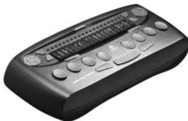
MPO 5500 (700 g) – dit apparaat beschikt over een ingebouwde gsm die toegankelijk is met braille (sms lezen in braille)

Hierna volgt een overzicht van de ons bekende apparaten op het ogenblik van publicatie; omdat gewicht bij dit soort hulpmiddelen een essentieel gegeven is, vermelden we het telkens tussen haakjes.