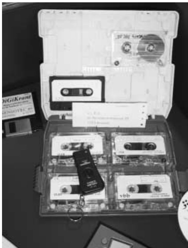
Het verdriet van België op cassette

Een daisyboek op cd kan gelezen worden met een daisyspeler, met een leesprogramma op pc en met een mp3-speler. In dit laatste geval zijn de mogelijkheden wel heel beperkt.