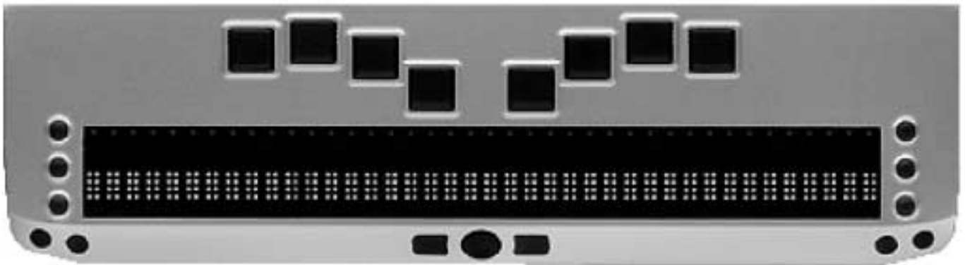
VarioConnect 24/32/40 (420/500/600 g)