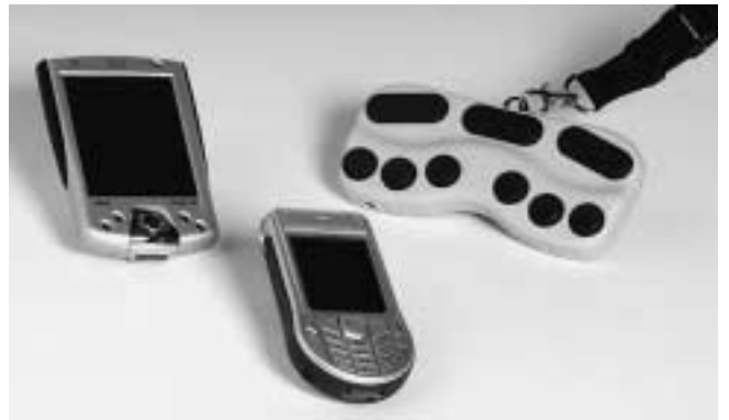
EasyLink (130 g)