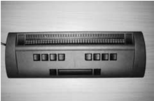
BrailleWave (1000 g)