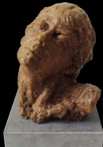
Bernadette Verbelen Brons en polyester