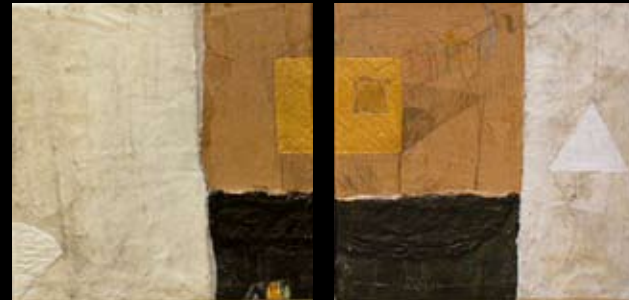
Sabini Mai Schilderijen