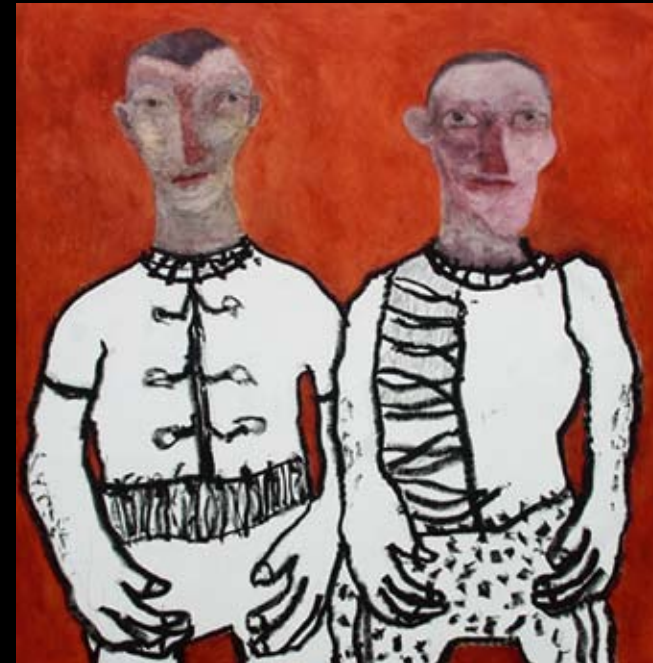
Dirk Boulanger Schilderijen en eigenzinnige meubelsculpturen