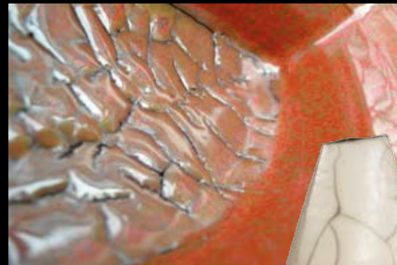
Dirk d'Hoine Keramik