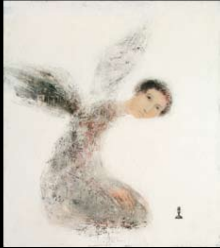
Alexey Terenin Acryl en olieverf op doek