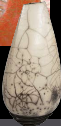
Greet Decoster Keramik